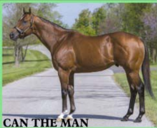
CAN THE MAN