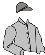
SÃO JOSÉ DO BOM RETIRO

9 DE JUNHO DE 2016 QUINTA-FEIRA - 20:30 HORAS TATTERSALL DO JOCKEY CLUB BRASILEIRO