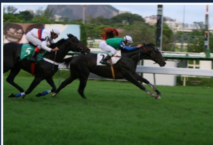
INVICTUS (1° G1)