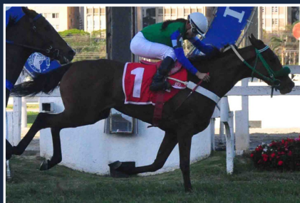
LAST KISS (1° G1)