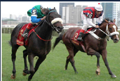
HOOK THE PIRATE (1° G1)