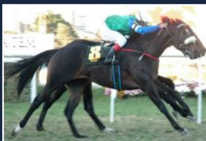
GALLAHAD (1° G1)