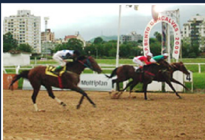
GOECOCHEA (1° G1)