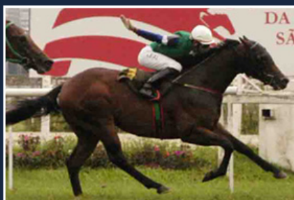
IAQUINTA (1° G1)