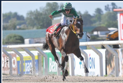
FUI TAMBÉM (1° G1)